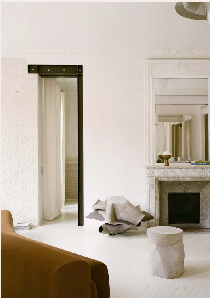
WONEN EN KOKEN