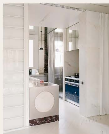
WONEN EN KOKEN