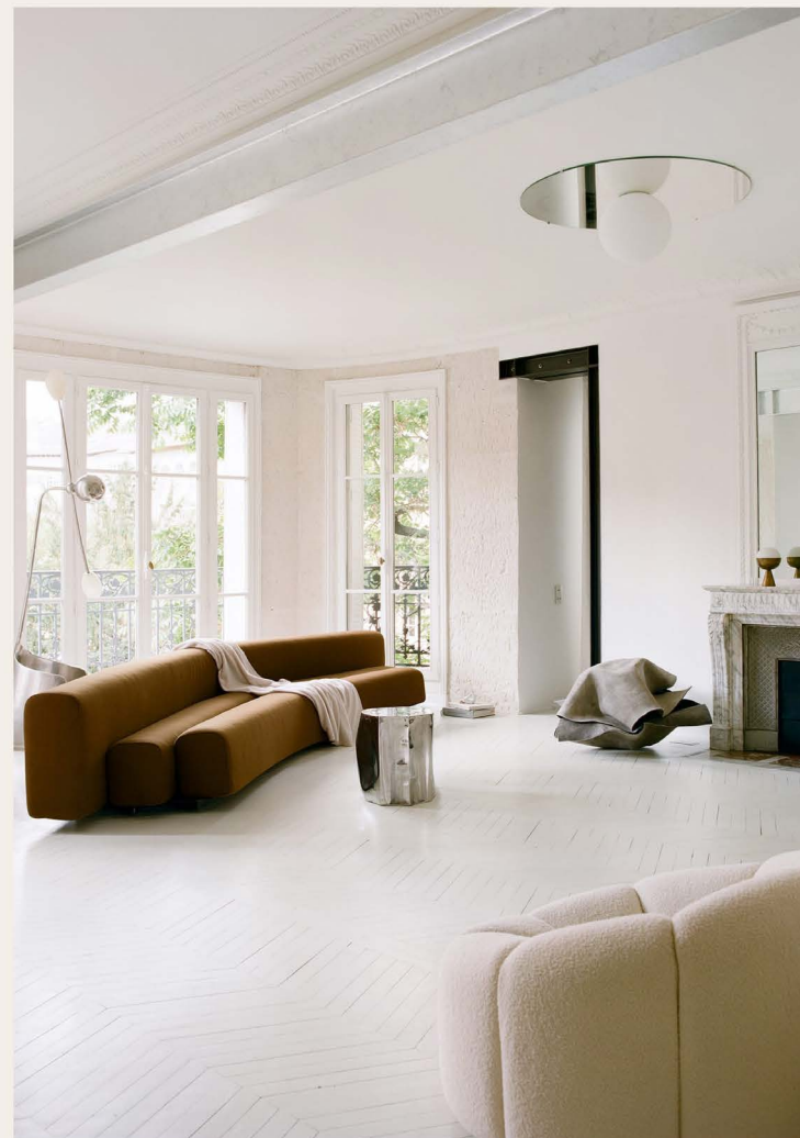
75 VAN EEGHENSTRAAT 17